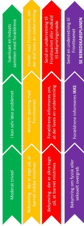
Figur 1 – Forskellige grader af bekymring og tilhørende handlinger.